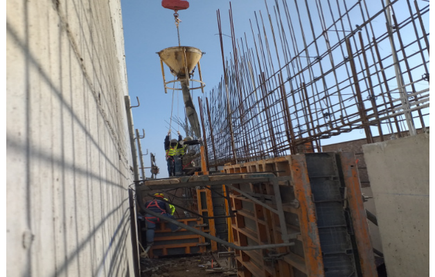
Hormigonado de muro eje Q/1-3, piso 1, sector contra sacristía, Templo mayor.