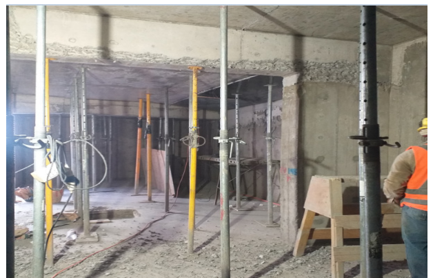
Descarachado y maquillaje de vigas, losa cielo subterráneo, sector ejes 8-9/N-P.