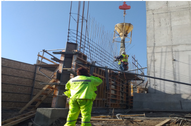
Hormigonado de muro eje B/1-2, piso 1, sector flores, Templo mayor.