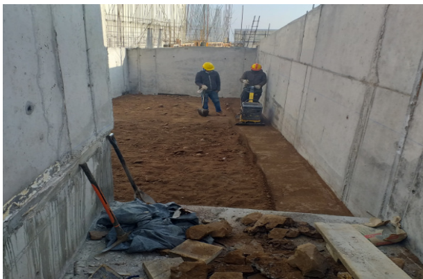
Construcción de relleno compactado, capa 02, sector capilla del santísimo.