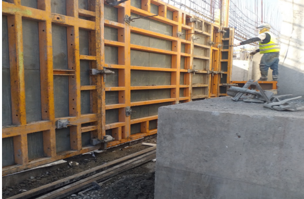
Descimbre muro eje Q/1-3, piso 1, sector contra sacristía, Templo mayor.