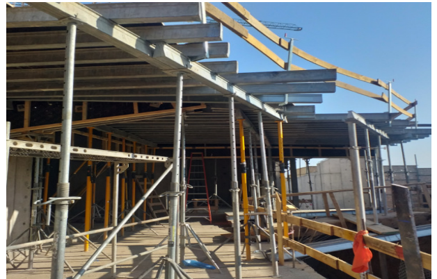
Avance moldaje placas losa cielo piso 1, sector alero sobre guardería.