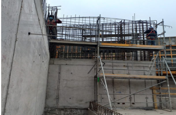
Avance armadura núcleo muros ejes 1-19/U2-U1-19a, piso 2, etapa 2, sobre acceso N°2, Templo mayor.