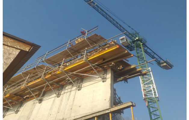
Hormigonado de muro eje 1a/T-U2, piso 2, etapa 2, coronamiento.