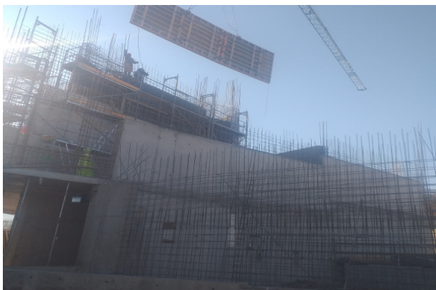
Instalación de moldaje 1° cara, muro eje U2/19a-5, piso 2, etapa 3, sector coro, Templo mayor.