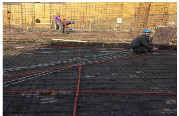
Avance armadura e instalaciones losa cielo piso 1, ejes 12-13/Q-G, frente salón parroquial.