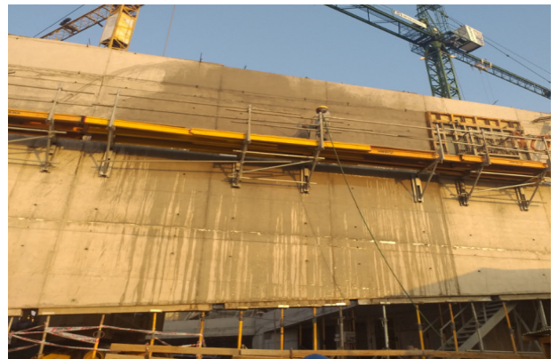
Curado por riego, muro eje 1a/R1-T, Templo mayor.