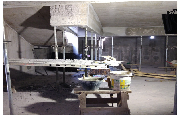
Descarachado y estucado de vigas, cielo subterráneo, sector escalera patio memorial.