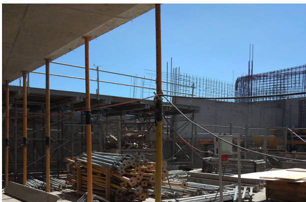
Instalación de torres cimbra, moldaje muro invertido eje P/7-11, cielo piso 1, templo menor.