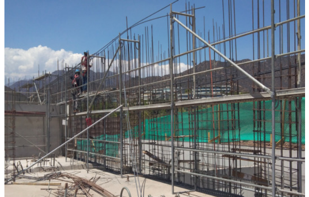
Avance armadura muro eje 10/