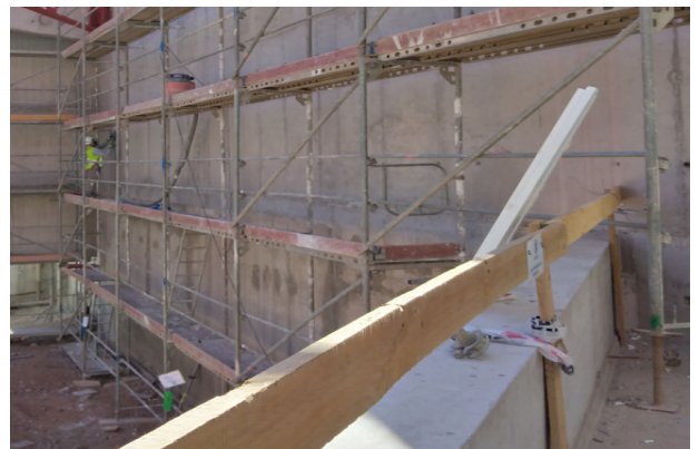
Descarachado y pulido muro eje 5/V-R, templo mayor.