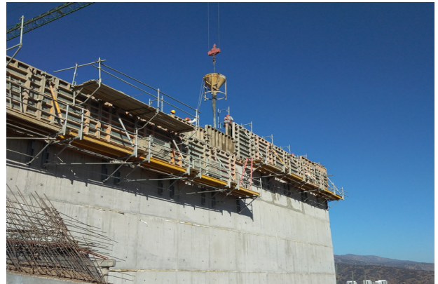
Hormigonado de muro eje Q/1-5, piso 2, etapa 5, coronamiento, templo mayor.