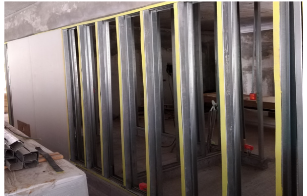
Instalación de banda de estanqueidad acústica en tabiques sacristía, templo mayor.