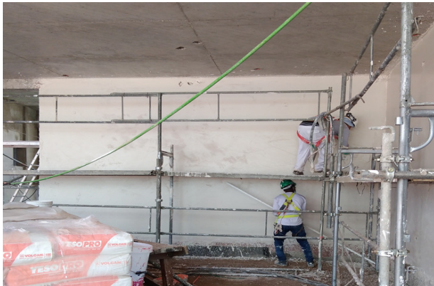
Enlucido con yeso de muro eje 5/T-V, piso 1, sector pila bautismal.