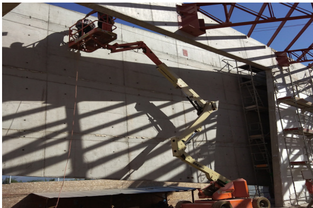
Instalación de placas de anclaje para vigas metálicas, ejes 1-1a, templo mayor.