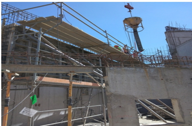
Hormigonado de muro eje 18/S-T2, piso 2, etapa 2, sector oratorio.