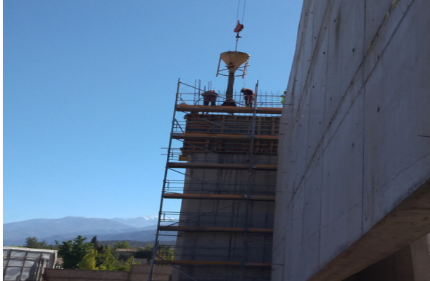
Hormigonado de muro eje Q/1-5, piso 2, etapa 4, templo mayor.