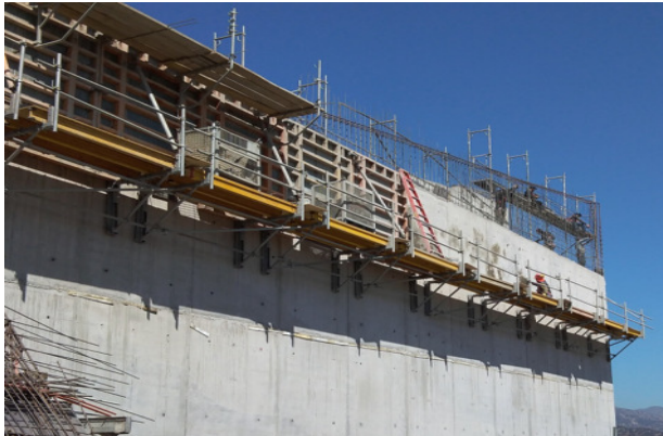
Descimbre muro eje Q/1-5, piso 2, etapa 4, templo mayor.